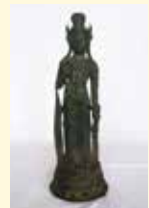
銅造観音菩薩立像

奈良時代前期の金銅仏である銅造観音菩薩立像は、蟬型原型から鑄造されたもので、ほほからあごにかけては柔らかい円味があり、体にはのびのびとした自然さがあります。市指定有形文化財の経筒とともに公開します。