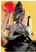
国指定重要文化財 木造愛染明王坐像

重要文化財「木造愛染明王坐像」は、鎌倉時代後期に作られた檜の寄木造の木像です。頭に獅子の冠を戴き、忿怒の表情がいきいきと表現され、芸術的に大変優れていると評価されています。長い歴史の中で火災や中越地震を乗り越え、多くの人々に信仰されてきた本像を1日限定で御開帳します。