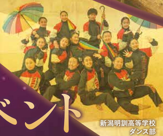
新潟明訓高等学校 ダンス部