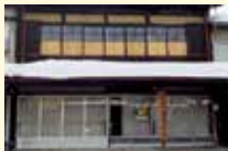
旧早川タンス店 (越後高田我楽多市楽座) 店舗

城下町高田の材木屋が集まった町にあるタンス店の建物です。間口が4間半の大きさと、一階に雁木が付き、雪国高田の木造建築を示す太い梁などが特徴です。当日は、旧早川タンス店で陶器や食器、衣料品などの生活雑貨や、骨董品などが販売されます。建物やタンスづくりの職人が使用していた道具の見学も可能です。