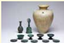
木崎山出土地鎮具

常設展示室で展示している木崎山出土地鎮具について、1980年の発掘当時のエピソードを交えて解説会を行います。