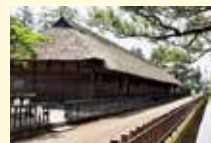
旧新発田足軽長屋

天保13(1842)年に建築された旧新発田藩下級武士の間口3間の棟割長屋で、8軒1棟の住宅です。かつては、川沿いに4棟が1列に並んでいた「清水谷長屋」の北側から2棟目に相当します。内部は簡素な造りです。 ※期間中の入園者には、ポストカードをプレゼントします。