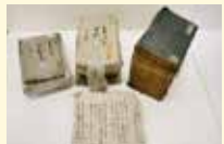
新潟県指定有形文化財 榊原家資料

上越市には、かつて越後国の政治・経済の中心であった越後国府が置かれ、「越後の都」として栄えました。常設展示では、「越後の都」を中心に捉え、地域の産業や文化、雪国のくらしを紹介しています。県指定有形文化財の榊原家資料も展示しています。