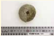
的場遺跡出土石製紡錘車

新潟市文化財センターでは、県指定有形文化財的場遺跡出土遺物を展示します。遺跡は、新潟市西区的場流通1丁目にあり、古代の役所の一部と考えられ、鮭漁に関する資料などが発見されています。また、遺跡も県指定を受け、現在史跡公園として親しまれています。