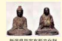
新潟県指定有形文化財 木造男神女神坐像

史跡宮口古墳公園にある、資料館です。県指定有形文化財の木造男神女神坐像と宮口古墳群昭和五十年発掘出土品を展示しています。このほか、古墳に関係する資料や、牧区の民俗資料を展示しています。