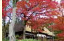
重要文化財 旧目黒家住宅

絶景の紅葉路線で名高い只見線が昨年再開したことに伴い、目黒家と縁のある只見線の秋のキャンペーンを実施します。期間中、目黒邸と目黒邸資料館の共通入場券を購入された方から、抽選で新米の魚沼産コシヒカリをプレゼント!