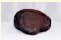
新潟県指定天然記念物 蘆池の隕石

上越清里星のふるさと館では、大正9年に清里区上中条に落下した、「蘆池の隕石」を展示しています。また、県内最大となる反射式望遠鏡での天体観測と、四季折々の天体観測ができるプラネタリウムも備えています。