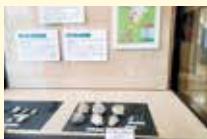
裏山遺跡出土ヒスイの展示

令和4年11月に翡翠(ヒスイ)が県の石に指定されたことを記念して、市内の遺跡から発掘調査で見つかったヒスイの原石や加工品を展示します。