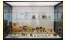
南赤坂遺跡出土古墳時代土師器

新潟市文化財センターでは、県指定有形文化財の南赤坂遺跡出土遺物を展示します。南赤坂遺跡は、新潟市西蒲区竹野町にあります。古墳時代前期の集落跡から出土した、北方民と接触があったことを示す貴重な資料です。