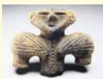
籠峰遺跡出土の土偶

上越市中郷区には、県指定史跡「籠峰遺跡」をはじめとした、数多くの縄文時代の遺跡が見つかっていきます。四季折々に姿を変える美しい妙高山を眺めながら縄文人のくらしぶりに思いを馳せ、古代ロマンを体感できる資料館です。県指定有形文化財「籠峰遺跡出土品」の一部を展示しています。