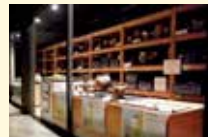
吹上遺跡出土品の展示

上越市内の埋蔵文化財を研究・保管・公開する施設です。市内の歴史に関する展示のほか、調査室の大きな窓からは、出土品の整理や復元作業を見ることが出来ます。春日山城跡のふもとにあり、豊かな自然になじむ土壁色の日本家屋風の建物です。県指定有形文化財「吹上遺跡出土品」の一部を展示しています。