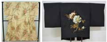
マジョリカお召 黒絵羽織

昭和34年(1959)に彗星のごとく登場した「マジョリカお召」と、その後PTALックと呼ばれて一世を風靡した「黒絵羽織」。昭和30年代後半から50年代にかけて大ヒット商品となった2つの十日町織物について、博物館所蔵の資料を中心に紹介します。