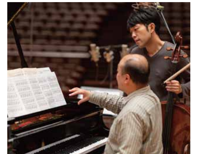
2020年12月23日発売 アルバム収録の様子 (柏崎市文化会館アルフォーレ)

あの時のコンサートは特別な体験でした。地域のオーケストラとチェロコンチェルトを共演したのですが、頭で「こう弾こう」とイメージするより先に、まるで背中を押されるように音が自然と紡がれていったんです。あれこそまさに、集中力が高まった真っ白な状態。呼吸も忘れるほどひとつの音楽に聴き入る瞬間を、観客と共有できたと思いました。演者と観客が共鳴しあって、音楽だけに包み込まれる感覚。作為的でないからこそ生まれるあの一体感を、コンサートを通じてま