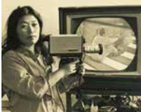
Shigeko Kubota Portrait

新潟県西蒲原郡巻町(現・新潟市西蒲区)で生まれ、ニューヨークを拠点に国際的に活躍したビデオ・アーティスト、久保田成子(1937-2015)の日本では約30年振りの個展を開催します。本展では代表的なビデオ彫刻作品として知られる「デュシャンピアナ」シリーズをはじめ、映像、ドローイング、資料などで初期から晩年までの活動を幅広くご紹介します。