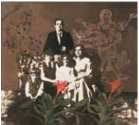
佐善明《クンシランの記憶》1982年、新潟市美術館

新潟市出身の佐善明(1936-91)は、フォト・モンターージュを駆使した油彩画を制作しました。写真によって断片と化した「記憶」は、われわれを追憶へと誘います。佐善の作品を中心に「記憶」と「写真」の関係について考えます。