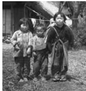
妹と弟の子守り

新潟市北区郷土博物館の所蔵資料から、50から80年くらい前の子どもたちが使っていた道具や当時の写真などを展示します。昭和半ば頃までの子どもたちはいったいどのような生活をしていたのでしょうか。この機会にぜひご家族皆さままで足をお運びください。