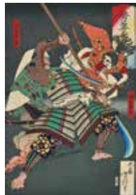
《芳年武者先頭 源牛若丸 熊坂長巻》明治16年(1883)

最後の浮世絵師、月岡芳年(つきおかよしとし)の“すべて”が分かる決定版!月岡芳年(天保10-明治25/1839-92)は、「血みどろ絵」「無惨絵」と呼ばれる初期のシリーズがその代名詞となりましたが、手がけたジャンルは武者絵、役者絵、怪奇絵、戦争画、美人画など多岐にわたります。本展では、素描や画稿、版木、肉筆画なども併せて展示し、芳年芸術の秘密に迫る内容です。