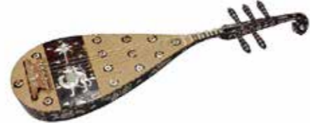
模造 螺鈿紫檀五絃琵琶 正倉院事務所蔵【前期展示~8/1】

明治時代に始まり、昭和47年(1972)からは、正倉院宝物の材料や技法、構造の忠実な再現に重点をおいて、重要無形文化財保持者(人間国宝)らの熟練の技と、最新の研究成果との融合によって生み出された精巧な再現模造の数々を一堂に公開します。