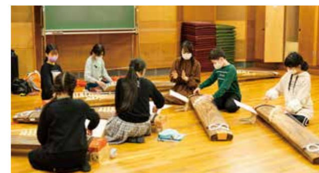
新潟市ジュニア邦楽合奏団の練習風景