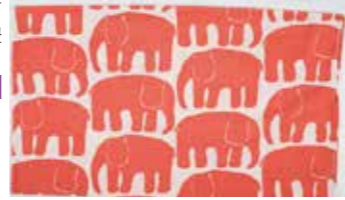
ライナ・コスケラ作「エレファンティ(象)」杖カパーニ製用生地(1909年)/タンペル歴史博物館 所蔵、Finlayson®©Finlayson Oy

フィンレイソンは寝具等のデザインや生産を手掛ける、北欧最古のテキスタイルブランドです。北欧の自然や植物、文化に着想を得たデザインは、200年以上の歴史を重ねても色褪せることはありません。本展では1800年代の見本帳や製品をはじめに1900~2000年代の代表的なデザインなど、北欧の暮らしに根差したテキスタイルブランドの歴史とデザインを紐解きます。